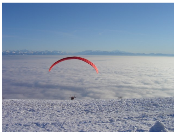
Mauborget - Jura suisse